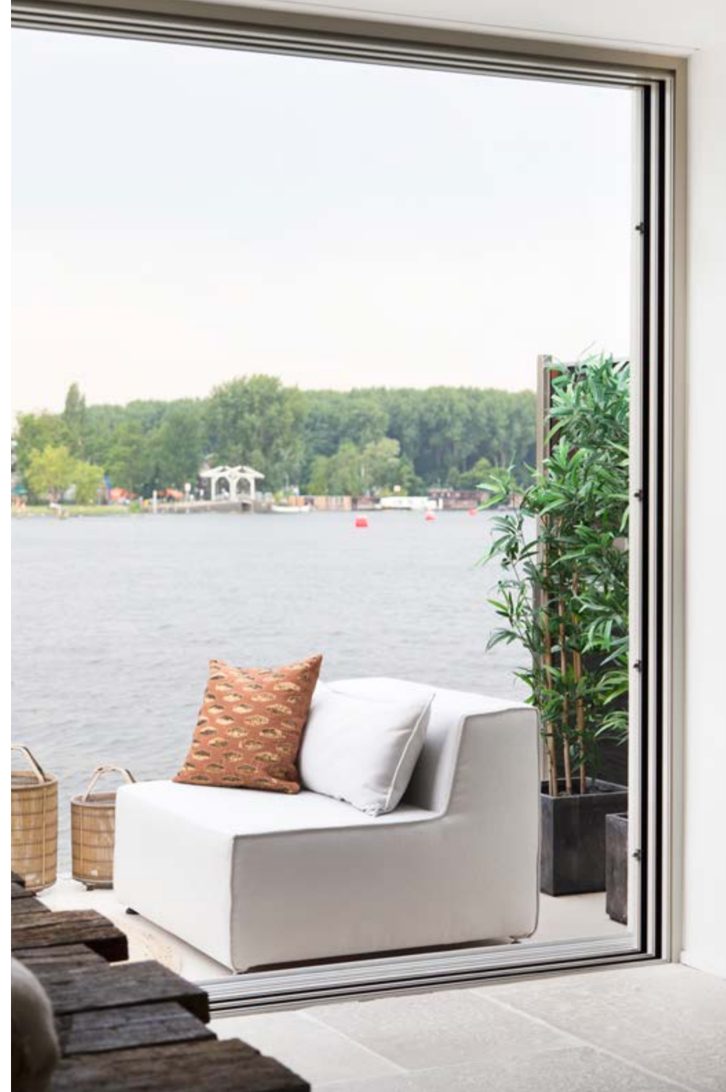
De woonverdieping heeft een twintig meter lange glazen pui met schitterend uitzicht over de Amstel.